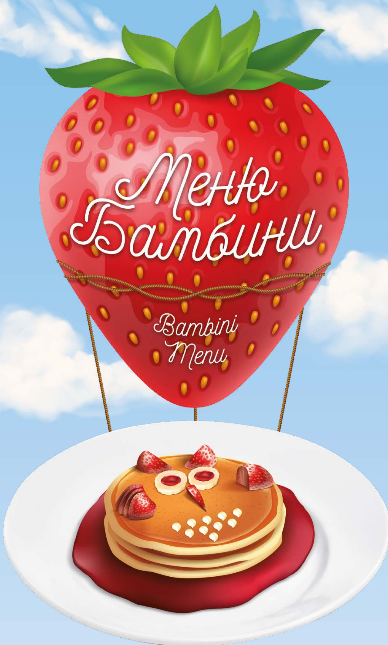
АПЕЛЬСИНОВЫЕ ПАНКЕЙКИ «СОБА» OWL ORANGE PANCAKES